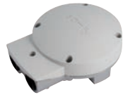
Heating Modulis Receiver RTS

Funkempfänger zum Dimmen und Ein- und Ausschalten von 230V-Verbrauchern mit einem Funksender. Speziell für Verbraucher mit hohen Einschaltströmen wie Halogen-Infrarot-Wärmestrahler.