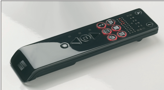
Abb. 1 WMS Handsender

Der WAREMA Mobile System (WMS) Handsender kann WAREMA WMS Empfänger fernsteuern. Die Empfänger bestätigen die empfangenen Befehle, der Handsender zeigt diese Rückmeldungen an.